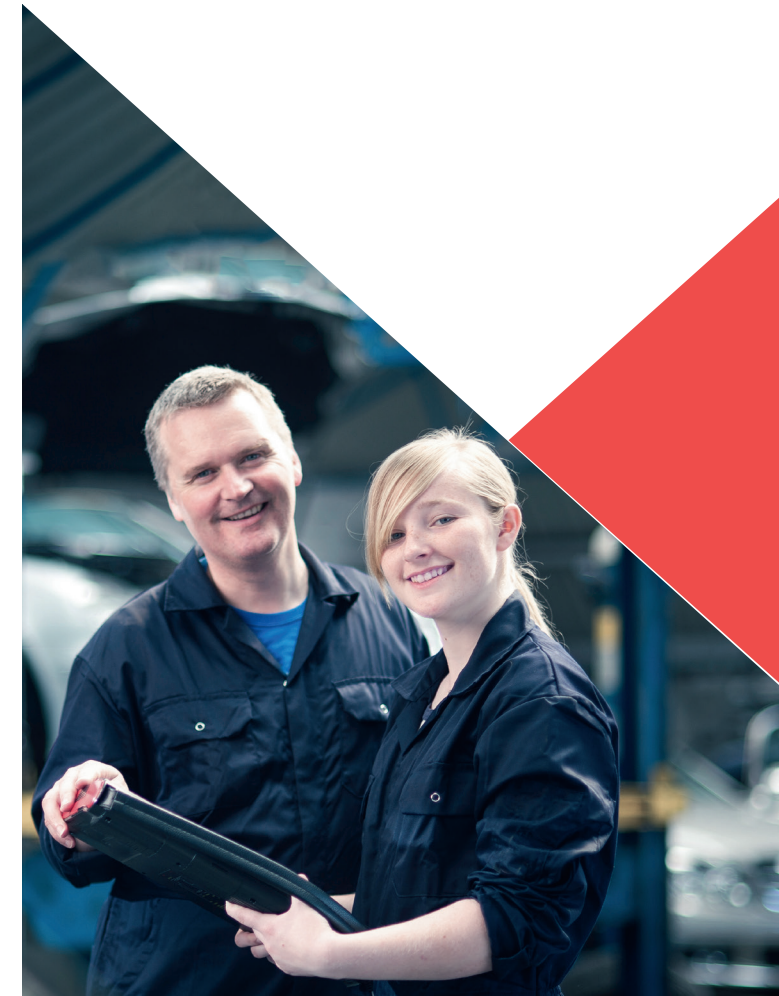
Mit finanzieller Unterstützung des Landes Nordrhein-Westfalen und des Europäischen Sozialfonds